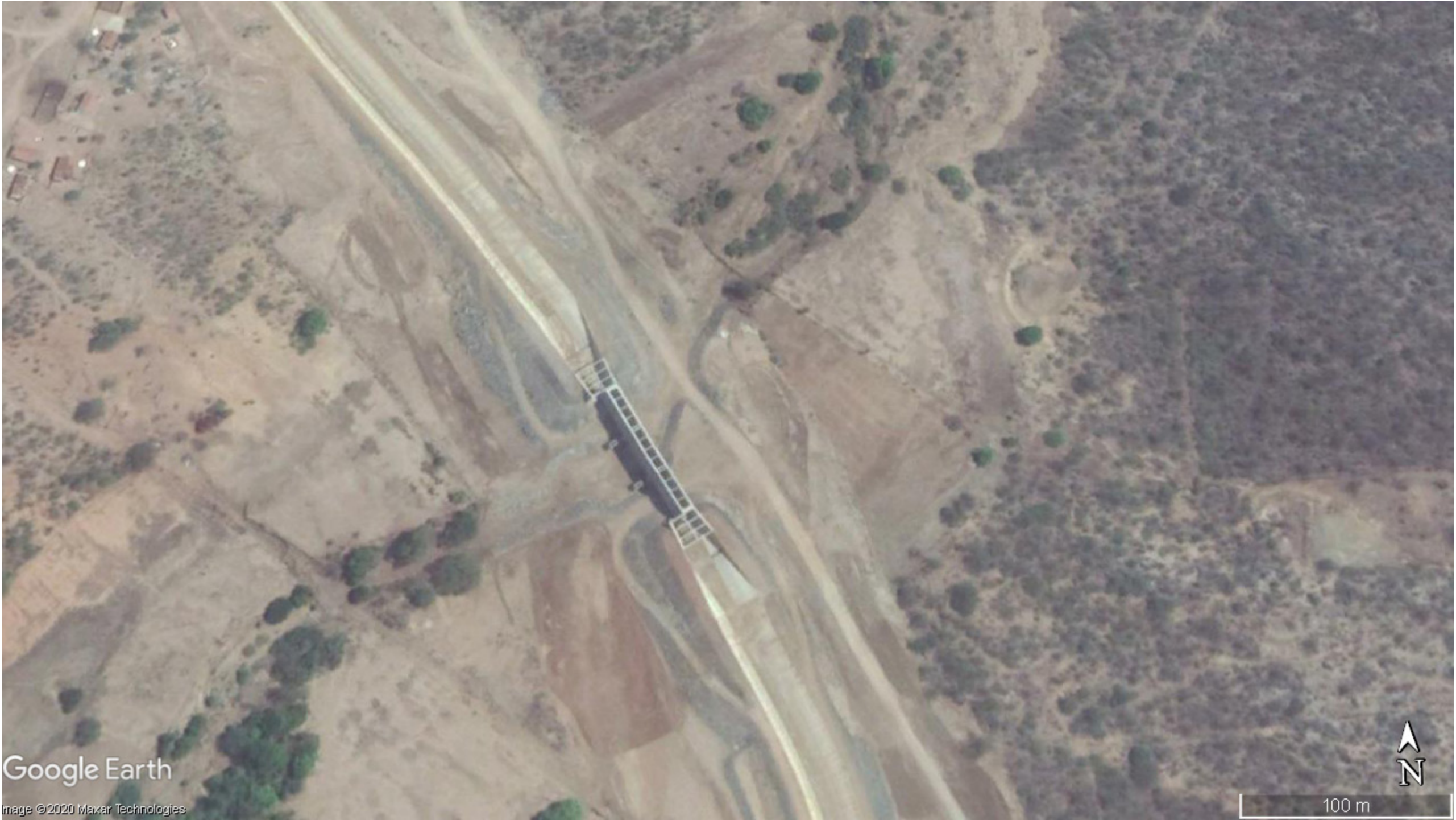
aqueduto sobre o rio - cabrobó