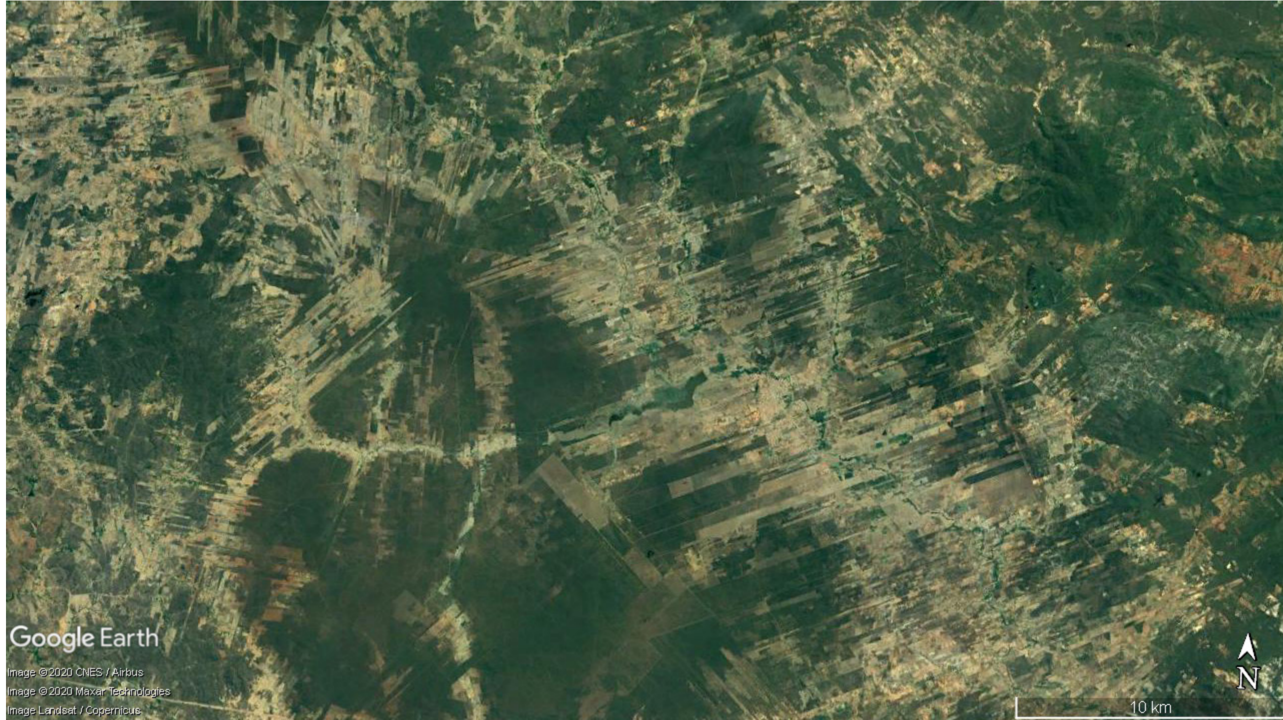
parcelamento do solo: lotes transversais aos cursos d'água