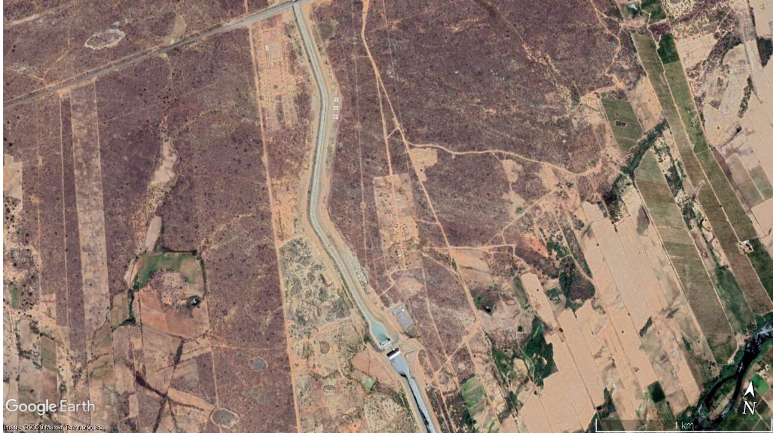
estação de bombeamento EBI-1 | vilas produtivas rurais