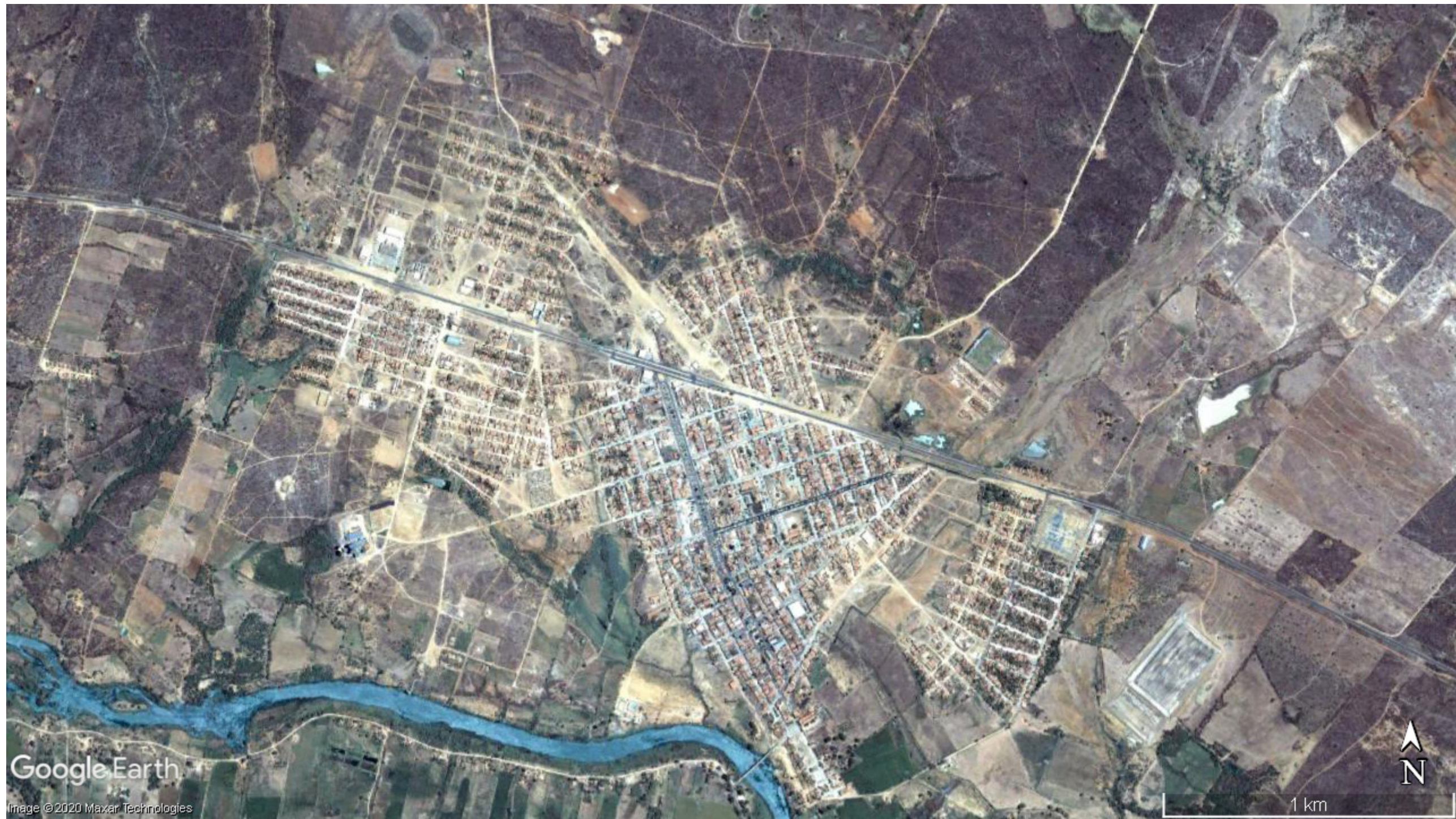
2008 área urbana