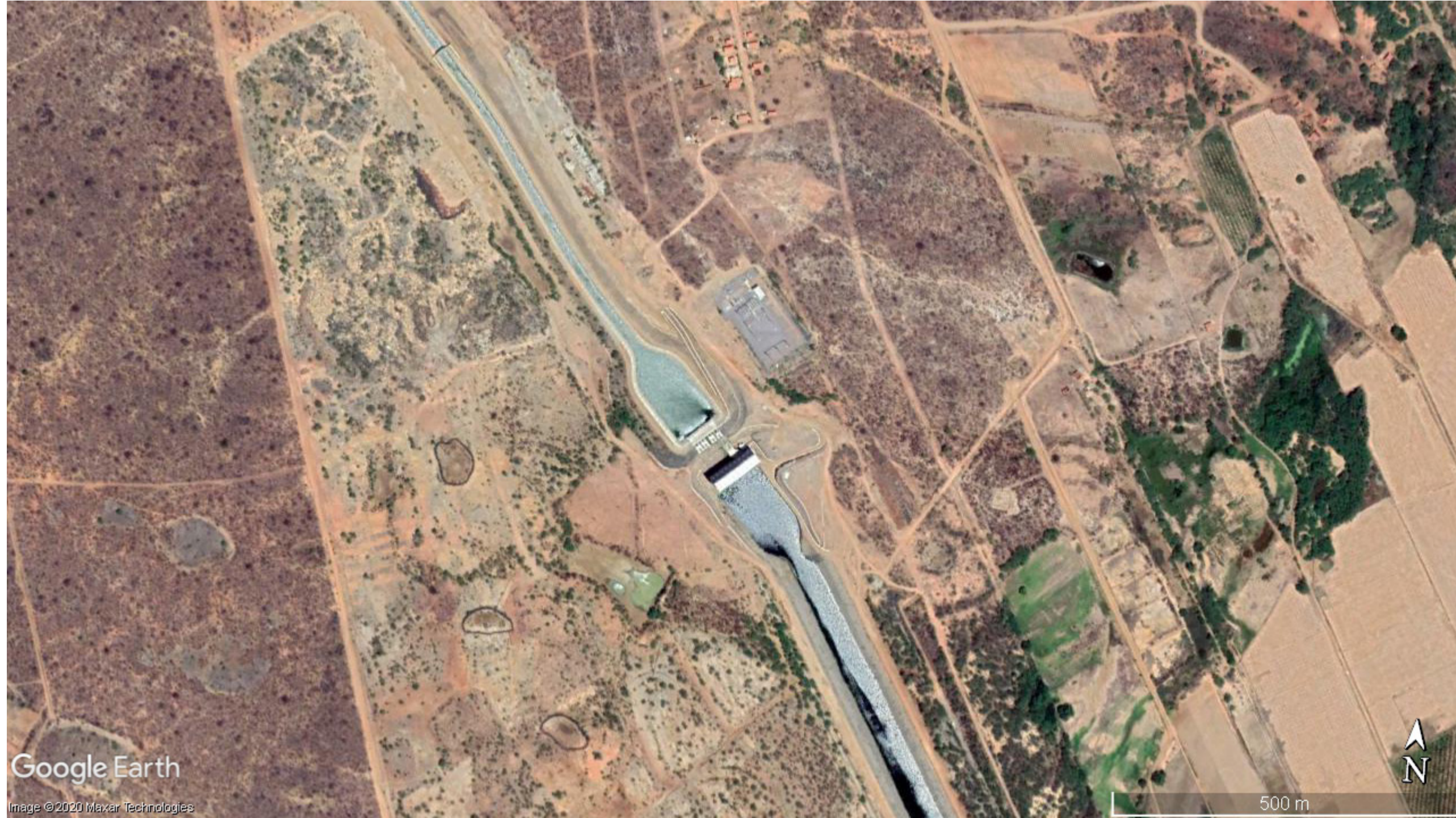
estação de bombeamento EBI-1