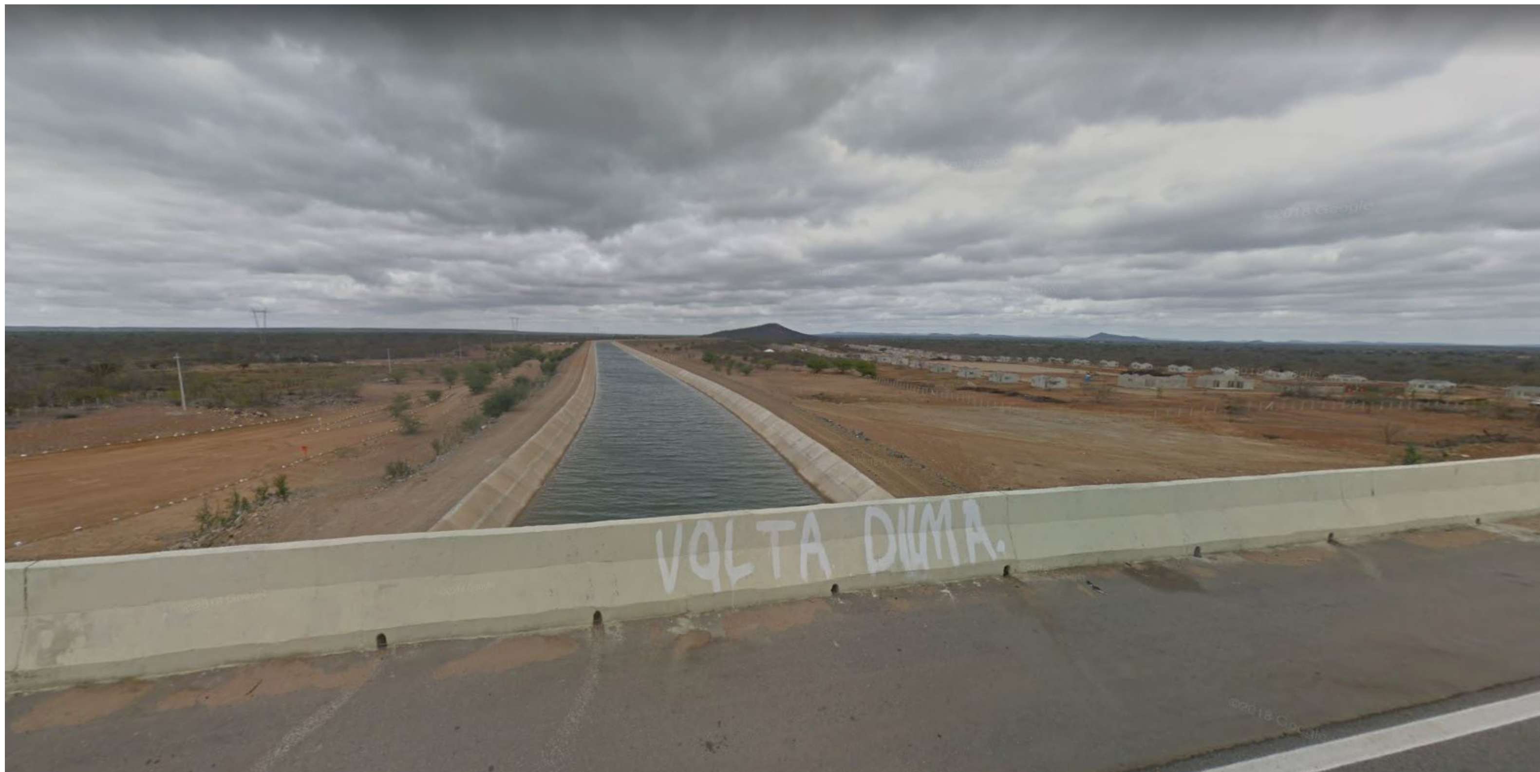
canal x vpr em construção